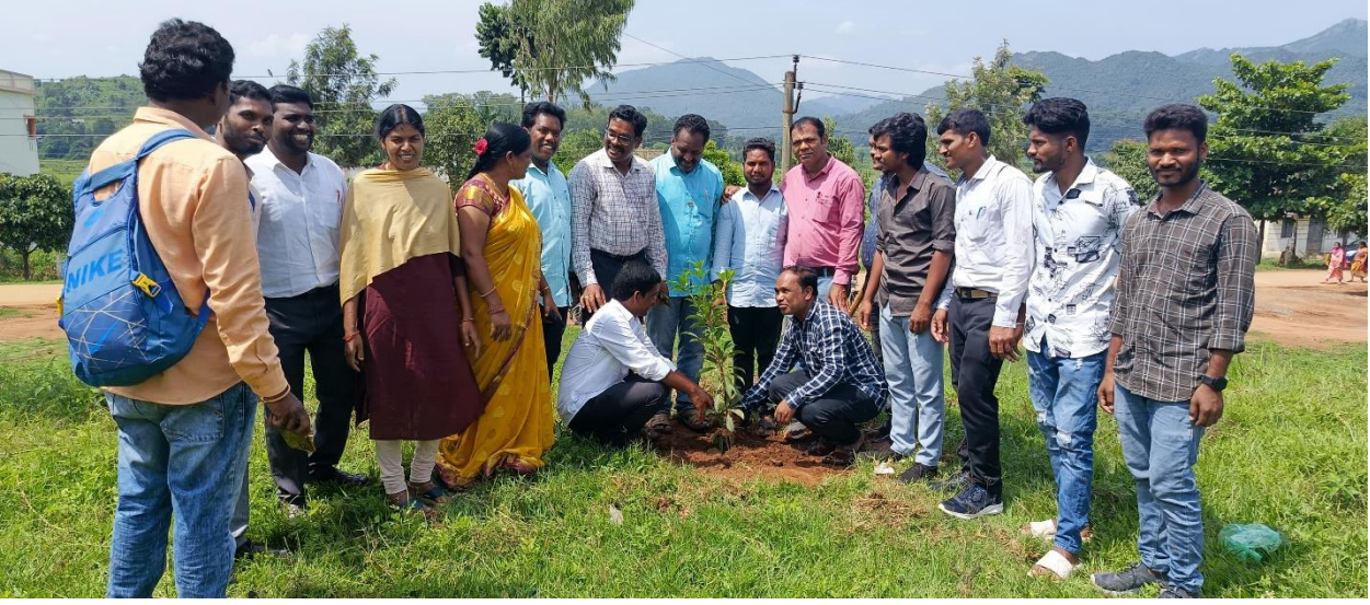
A plantation program was conducted by the alumni members on the campus.